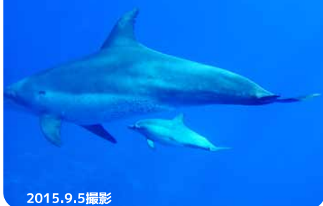
子イルカと一緒に泳ぐ #19

地図上の黄色枠は、目撃されたおおよその場所を示し、 枠内の番号は地図横のものに対応