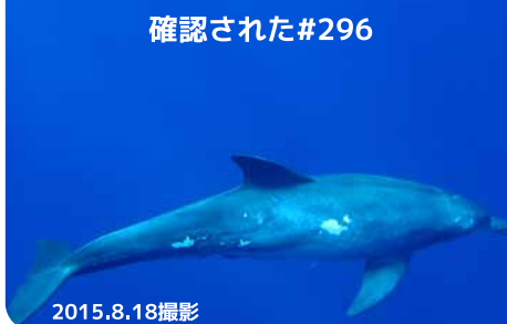
子イルカと一緒に泳ぐ姿が 確認された #296